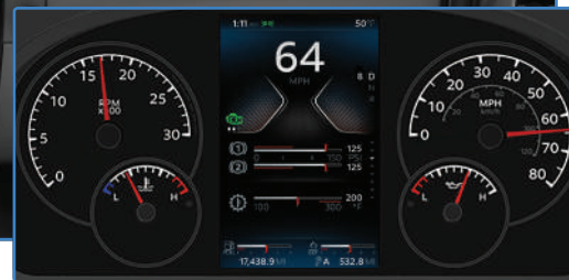
Tableau de bord standard avec affichage numérique de 7"

Le nouvel écran numérique haute définition de 7 pouces utilise une technologie de pointe pour fournir des informations d'exploitation critiques au conducteur de manière intuitive, efficace, avec un minimum de distraction. Demandez le Kenworth SmartWheel® pour un accès du bout des doigts à toutes vos commandes.